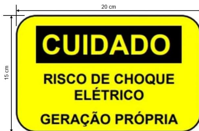
Figura 1 - Placa de Advertência de Geração Distribuída

Na entrada de serviço, junto às caixas de medição e proteção, deverá ser instalada uma placa de advertência, confeccionada em PVC com espessura mínima de 1 mm, dimensões 20x15 cm, fundo na cor amarela e dizeres em preto, conforme figura 1 abaixo.